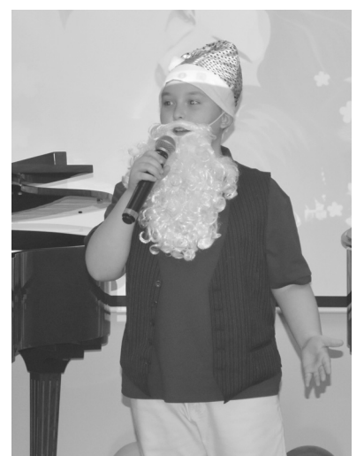
Воспитанники школы искусств радовали зрителей стихами, игре на фортепиано и баяне