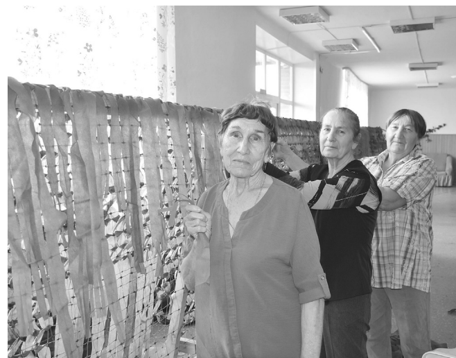
Ветераны в сельских поселениях плетут маскировочные сети и костюмы лешего