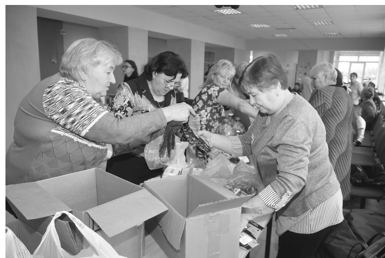
Регулярно в селах идет сбор посылок для наших бойцов

ботниками культуры помогает расширить поле творческой деятельности и воплотить задуманные идеи. Ежегодно первичные ветеранские организации участвуют в фестивале-конкурсе ветеранских организаций «Родники». Становится традицией два раза в год проводить среди первичных организаций квиз «Шевели извилинами». Это мероприятие не только интересное и познавательное, но его можно отнести к категории таких занятий, как уйти от деменции.