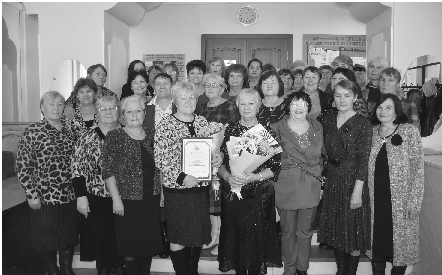
В работе итоговой конференции приняли участие председатели «первичек» и активисты ветеранских организаций