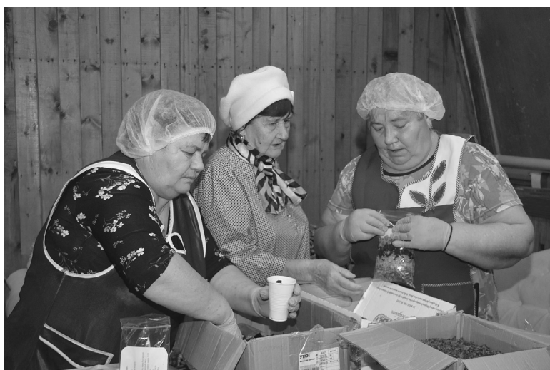
Пегановцы занимаются изготовлением сухих супов

О налаженной работе и взаимодействии с районным советом