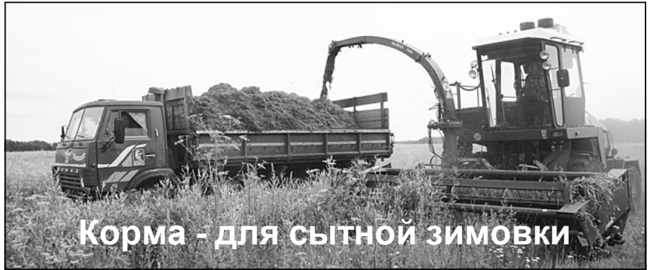
Корма - для сытной зимовки