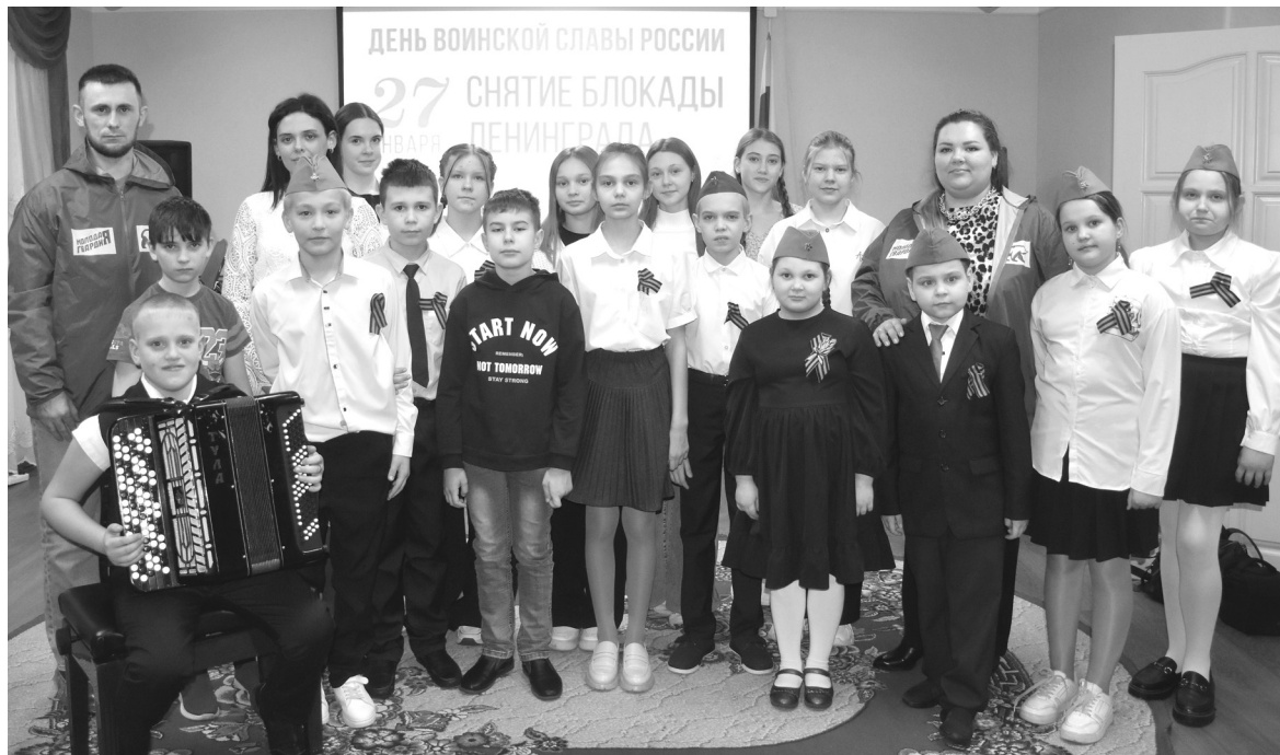
Юные музыканты и театралы подготовили для зрителей лучшие номера – песни, стихи и монологи