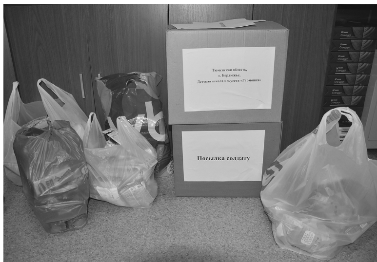
В школе искусств проходила акция «Посылка солдату»

- В конце декабря с ребятами стали разучивать произведения, которые вошли в концерт, - рассказывает Валентина Москвина. - На подготовку было мало времени, ведь из-за