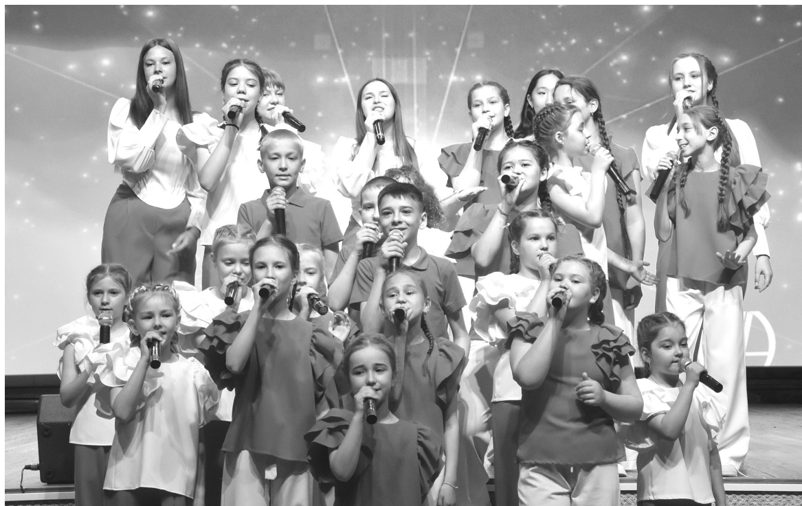
Вокалисты студий – яркие звездочки каждого концерта и мероприятия в Доме культуры