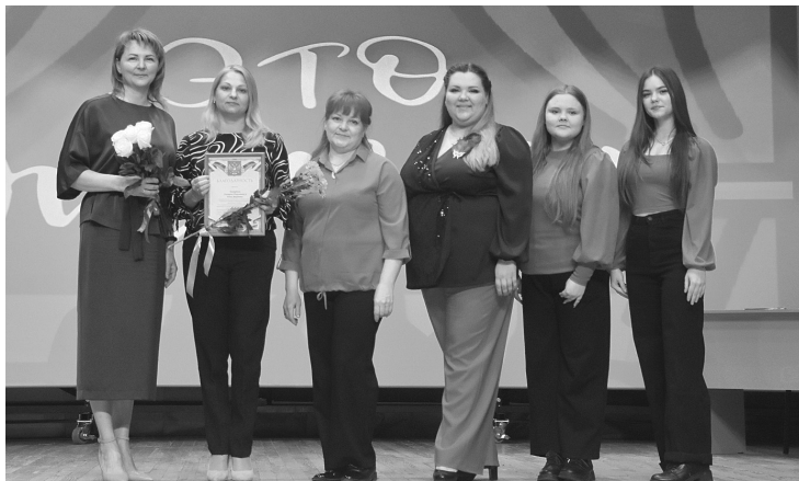
Талантливые выпускники и воспитанники театральной студии «Овация»