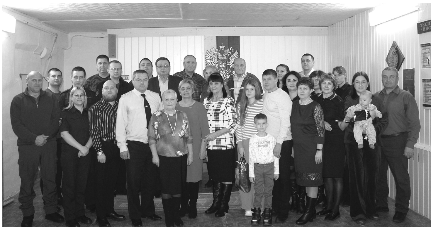
Сотрудники и ветераны встретились в отделении полиции, отметили активистов грамотами и подарками